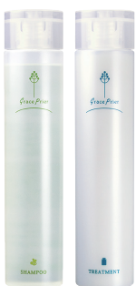
グレイスプリエ シャンプー トリートメント