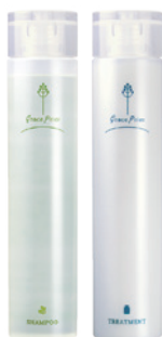
グレイスプリエ シャンプー トリートメント