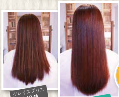
グレイスプリエ 使用前